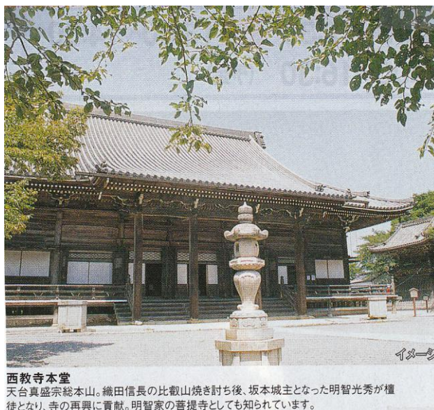
西教寺本堂 天台真盛宗総本山。織田信長の比叡山焼き討ち後、坂本城主となった明智光秀が檀徒となり、寺の再興に貢献。明智家の菩提寺としても知られています。