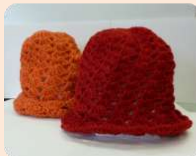
マイ帽子（編み上がりイメージ）

毛糸・かぎ針などは、こちらで用意しています。 お気に入りの材料・道具があれば、お持ちください