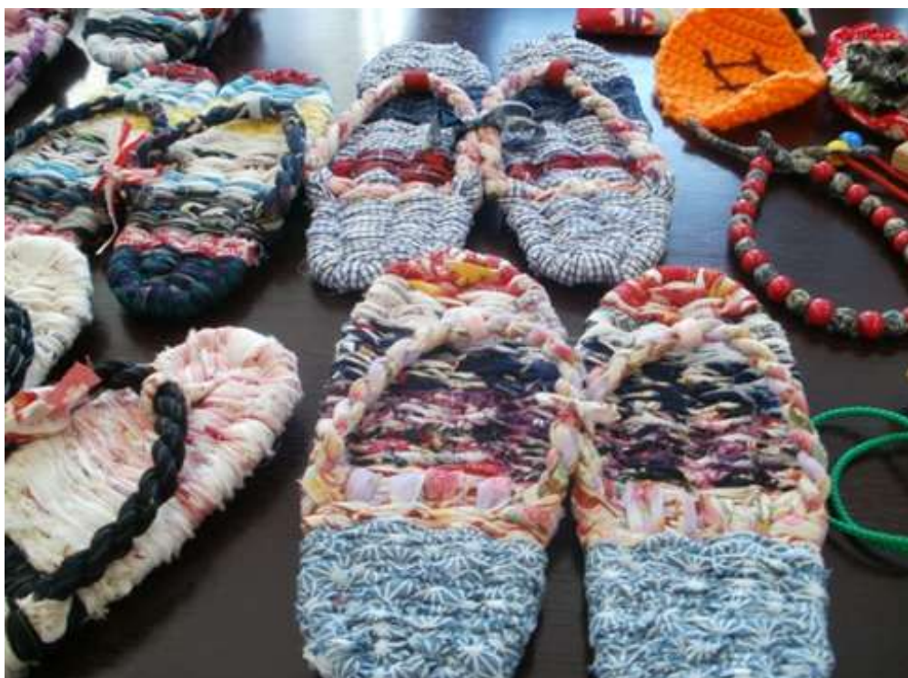
ウィズフェスティバル 2012・岡山きびの会ブースより