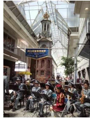
上之町時計台での 警察音楽隊の演奏会 風景